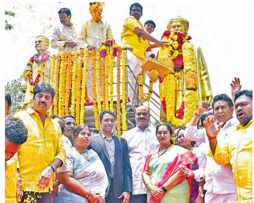
శనివారం మహారాష్ట్రా జ్యోతిబా పూలే జయంతినందర్లంగా ఆయన విగ్రహానికి నివాళి అర్పిస్తున్న మంత్రులు