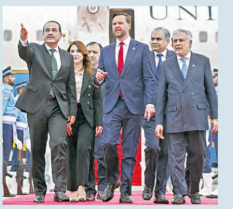
శనివారం ఇస్లామాబాద్ చేరుకున్న జెడివ్యాన్ బృందం ఇస్లామాబాద్, ఏప్రిల్ 11: ఇరాన్ పై యుద్ధం ముగింపు కోసం అమెరికా, ఇరాన్ దేశాలమధ్య జరుగుతున్న శాంతి చర్చల్లో పురోగతి కనిపించకపోయినా ఒకరి డిమాండ్ వార్షిక మరేకరం పంపకుండా.. >>2

ఇస్లామాబాద్ లో 'అమెరికా, ఇరాన్ మధ్య తొలిరోజు నాలుగు గంటలు చర్చలు పాక్ ప్రధాని షేహబాజ్ షరీఫ్ మధ్యవర్తిత్వం స్తంభించిన ఆస్తులు, నిధులు విడుదల చేయాలని ఇరాన్ డిమాండ్ కొత్త షరతులతో ముందుకు సాగని చర్చలు హార్డుకోపై కొనసాగుతున్న ప్రతిష్టంభన