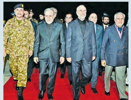
చర్చికోసం పాక్ వచ్చిన ఇరాన్ ప్రతినిధుల బృందం

ఇస్లామాబాద్ లో 'అమెరికా, ఇరాన్ మధ్య తొలిరోజు నాలుగు గంటలు చర్చలు పాక్ ప్రధాని షేహబాజ్ షరీఫ్ మధ్యవర్తిత్వం స్తంభించిన ఆస్తులు, నిధులు విడుదల చేయాలని ఇరాన్ డిమాండ్ కొత్త షరతులతో ముందుకు సాగని చర్చలు హార్డుకోపై కొనసాగుతున్న ప్రతిష్టంభన