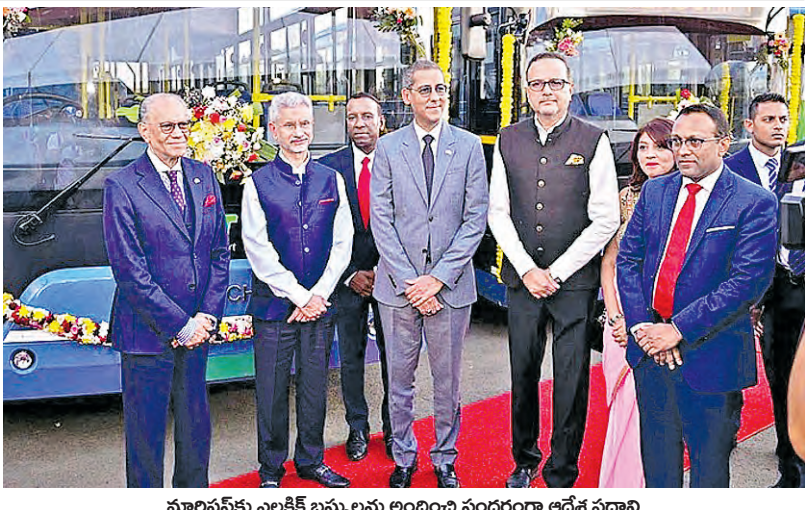
మాలిషస్కు ఎలక్ట్రిక్ బస్సులను అందించే సందర్భంగా ఆదేశ ప్రధాని నవీన్ రామిగులామ్, ఇతర ప్రతినిధులతో భారత విదేశాంగముంత్రి జైశంకర్

>>> చేస్తామని ప్రకటించారు. క్లీన్ అండ్ గ్రీన్ చేపట్టాం, క్లీన్ ఎన్వైరన్మెంట్ అండ్ కేర్ ఫర్ న్యూనాం, గతానికంటే డి.డి.పి ఓట్ల బ్యారంట్ పెరగాల్సి అని సీఎం చంద్రబాబు సూచించారు. ప్రభుత్వం అమలు చేస్తున్న సంక్షేమం, అభివృద్ధి కార్యక్రమాలతో పాటు... ప్రభుత్వం పడుతున్న కష్టాన్ని కూడా ప్రజలకు అర్థమయ్యేలా చెప్పాలని నేతలకు తెలియజేశారు. పార్టీ నేతలు, కార్యకర్తల కోసం ని3 ప్రాంగాం తీసుకోవాలని చెప్పారు. ఓ చేపడతామన్నారని. నా కుటుంబం కోసం ఏ విధంగా ఆలోచన చేశానో... డి.డి.పి కుటుంబం కోసం అదేవిధంగా ఆలోచన చేస్తున్నామని సీఎం చంద్రబాబు నాయుడు పేర్కొన్నారు. గత ప్రభుత్వం వైఖరిని దుయ్యబడుతూ, రాష్ట్రంపై వగ వట్టిసట్టుగా వ్యవహరించారని చంద్రబాబు ఆరోపించారు. బాబాయిని చంపిన నా చేతిలో కత్తి బట్టిన వాళ్లు ఎలాంటి రాజకీయమైనా చేస్తారు. అమరావతి పనులు వేగంగా జరుగుతుంటే చూసి సహించలేక అవినీతి జరిగిందని ఆరోపణలు చేస్తున్నారు. ప్యాజిటివ్ను, మూలా నాయకుల కంటే భారం రాష్ట్రాభివృద్ధిని అడ్డుకుంటున్నారని అని మండిపడ్డారు. రాష్ట్రానికి రాజధాని అమరావతిని పార్లమెంటు చట్టబద్ధత కల్పించడంపై సీఎం చంద్రబాబు హార్డు వ్యక్తం చేస్తున్నారని, సభకు హాజరైన ప్రజలు జై అమరావతి నినాదాలతో తమ మద్దతు తెలిపారని గుర్తుచేశారు.