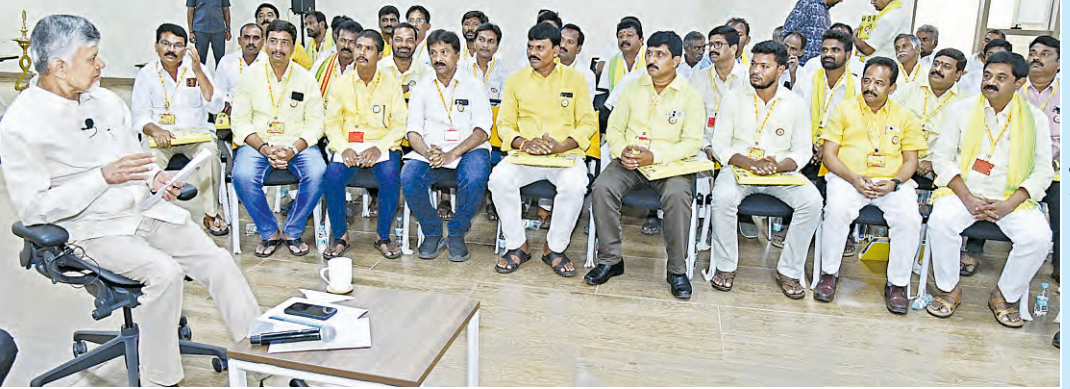
శనివారం టిడిపి కార్యకర్తల శిక్షణ కార్యక్రమంలో పాల్గొన్న సిఎం చంద్రబాబు నాయుడు

పార్టీనేతలు, కార్యకర్తలకు సిఎం చంద్రబాబు సలహా పార్టీ బలోపేతానికి 'ఇ-3' కార్యక్రమం ప్రభుత్వం కష్టాలు ప్రజలకు వివరించాలి శిక్షణ కార్యక్రమంలో పాల్గొన్న ముఖ్యమంత్రి